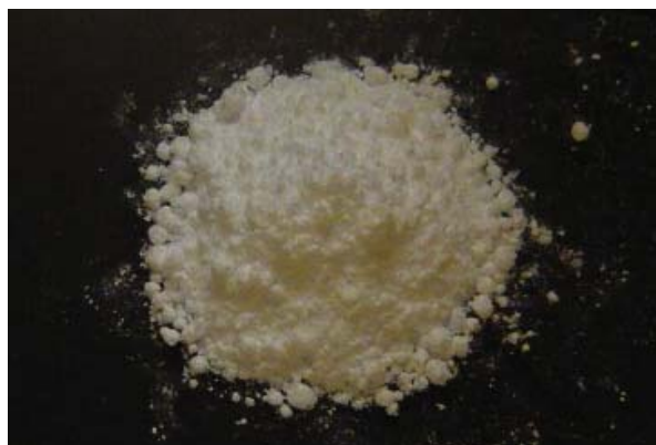
倍率 × 1