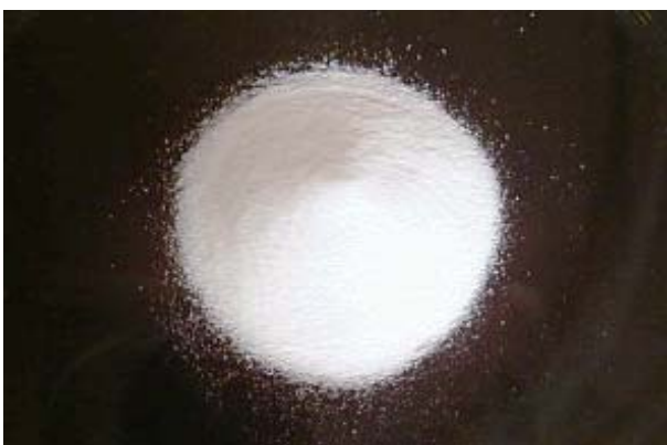
倍率 \times 1