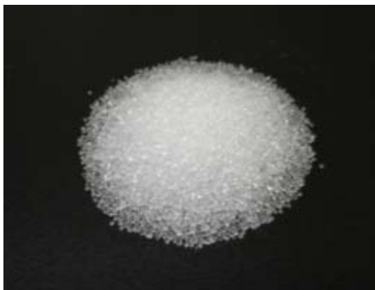
倍率 × 1