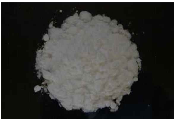
倍率 × 1