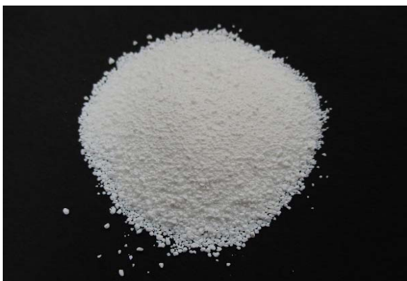
倍率 × 1