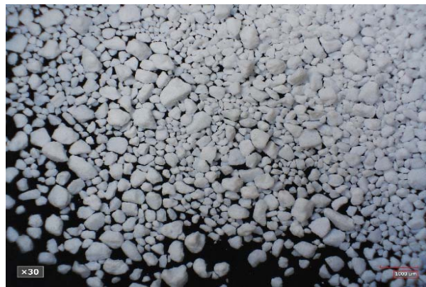
倍率 × 30